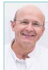
Dr. med. A. Höfle Ltd. Oberarzt, Schilddrüsenzentrum